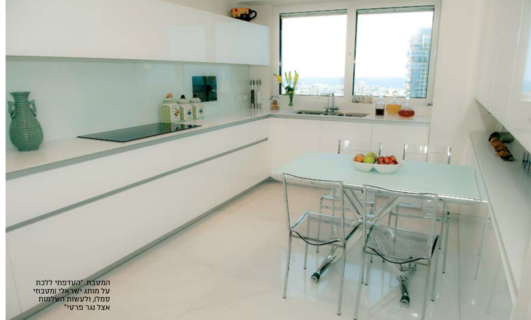
המטבח "העדפתי ללכת על מותג ישראלי (מטבחי סמל, ולעשות השלמות אצל נגר פרטי"