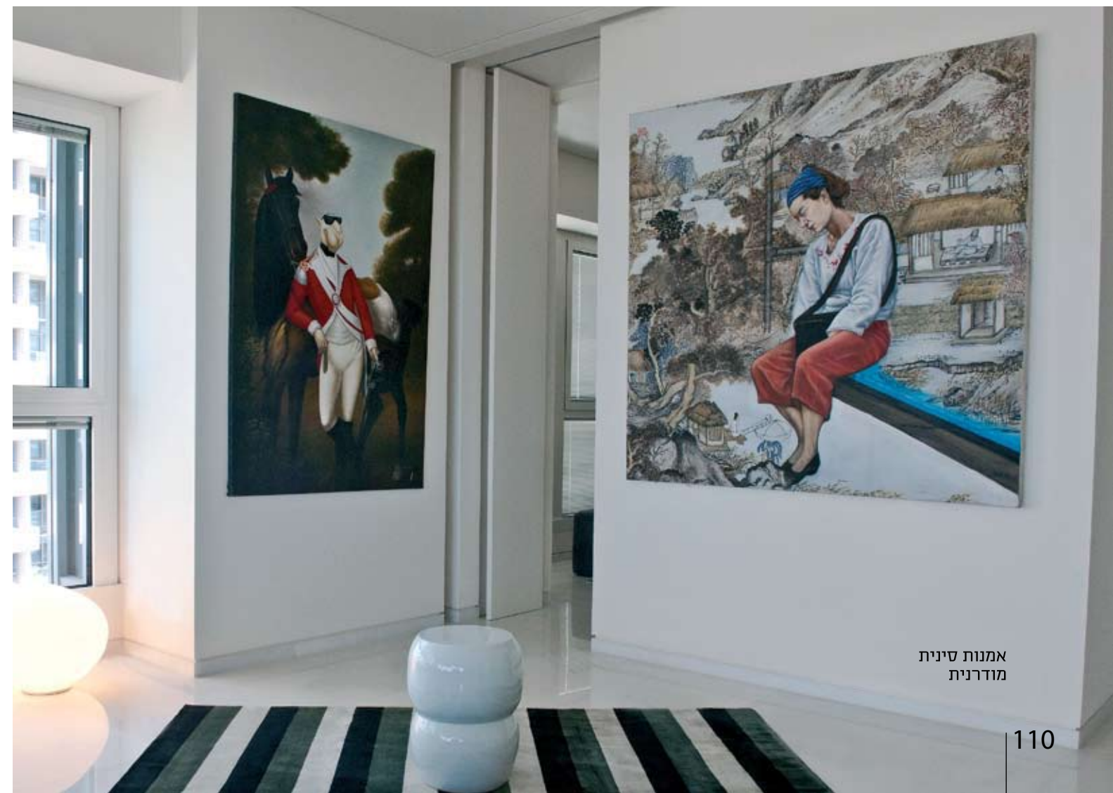
אמנות סינית מודרנית