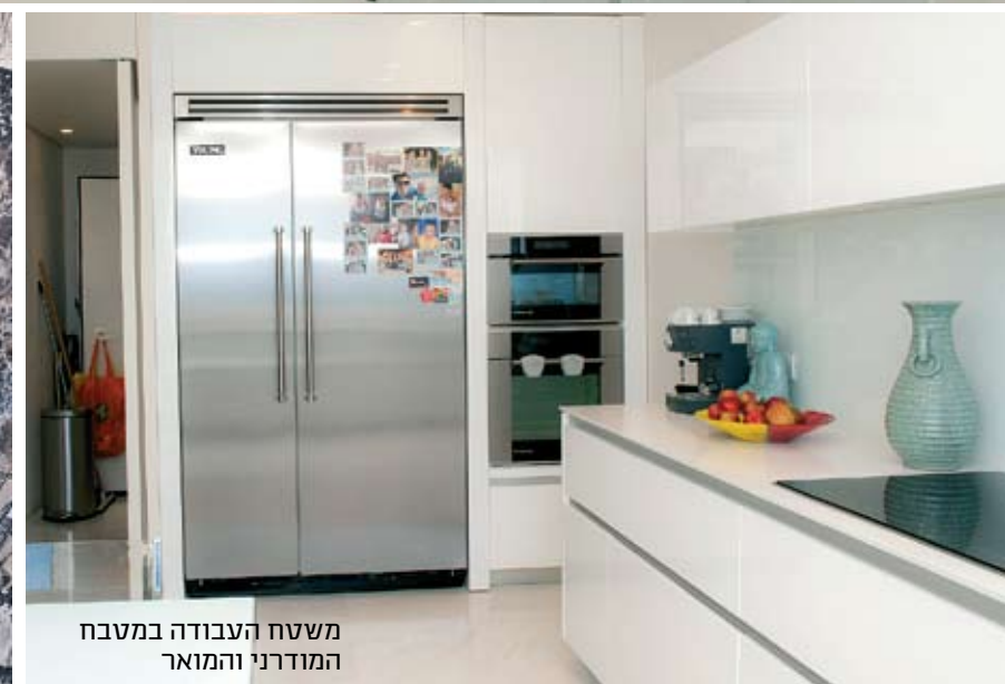
משטח העבודה במטבח המודרני והמואר