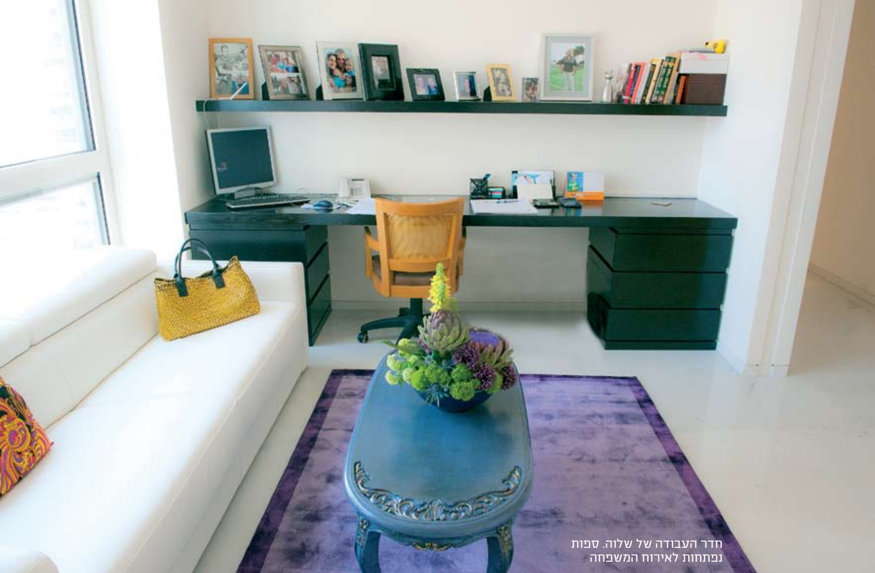
חדר העבודה של שלוה. ספות נפתחות לאירוח המשפחה