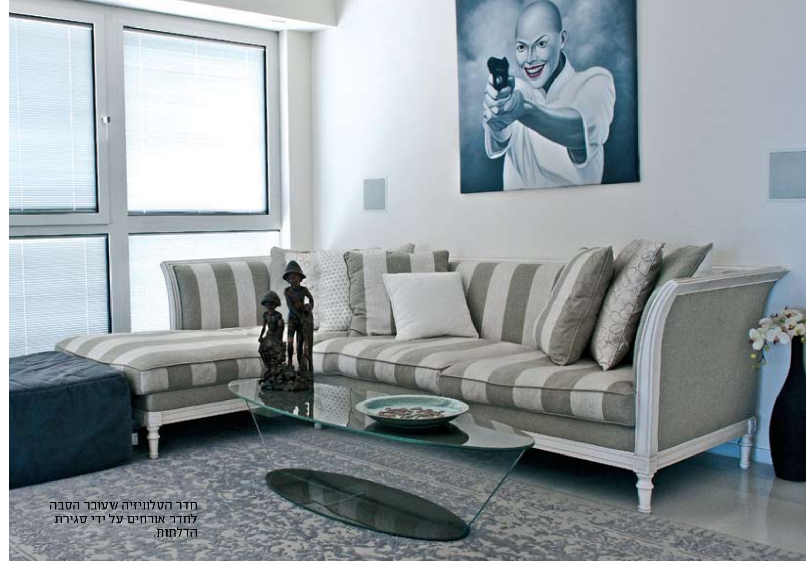
חדר הטלוויזיה שצובר הסבה לחדר אורחים על ידי סגירת הדלתות.