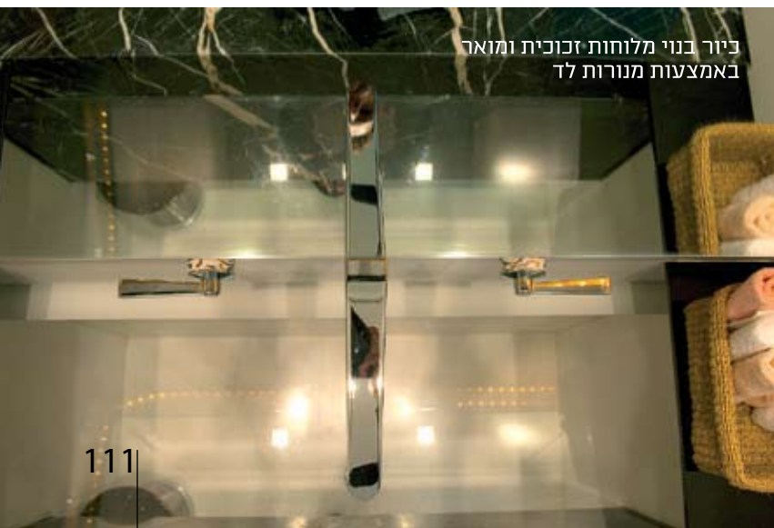
כיור בנוי מלוחות זכוכית ומואר באמצעות מנורות לד