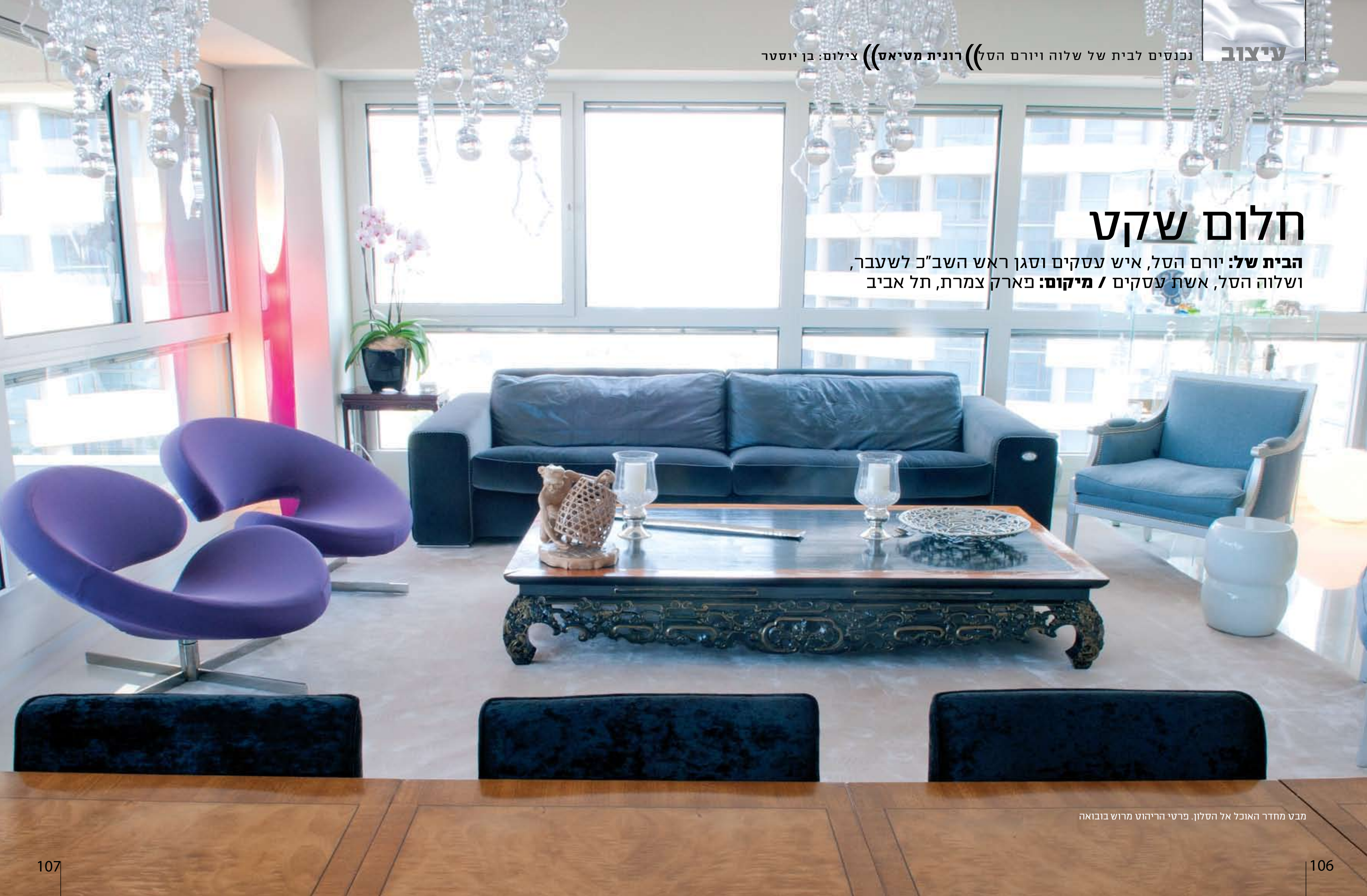
מבט מחדר האוכל אל הסלון. פרטי הריהוט מרוש בובואה