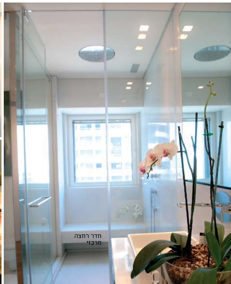
חדר רחצה מרכזי