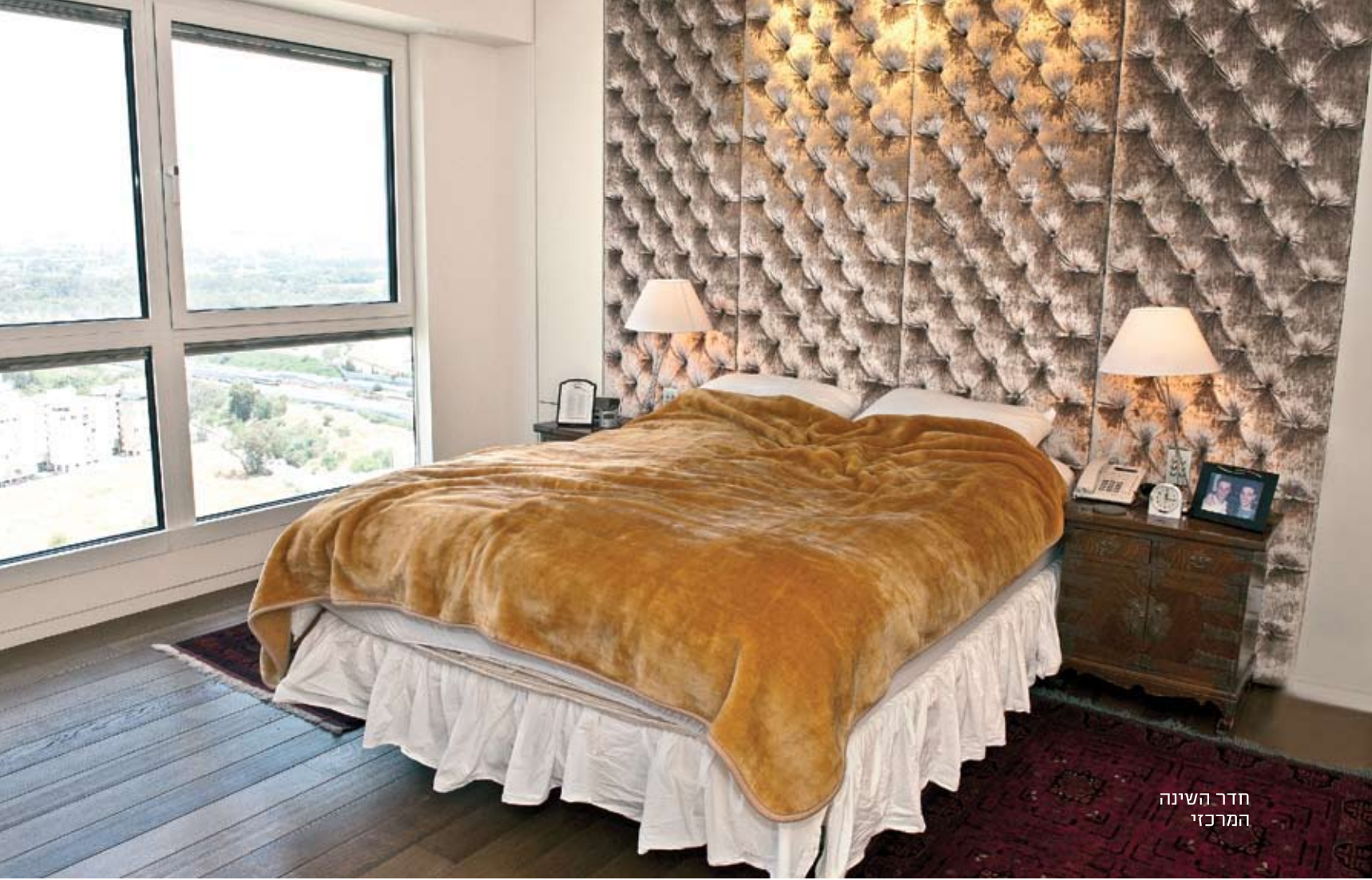
חדר השינה המרכזי