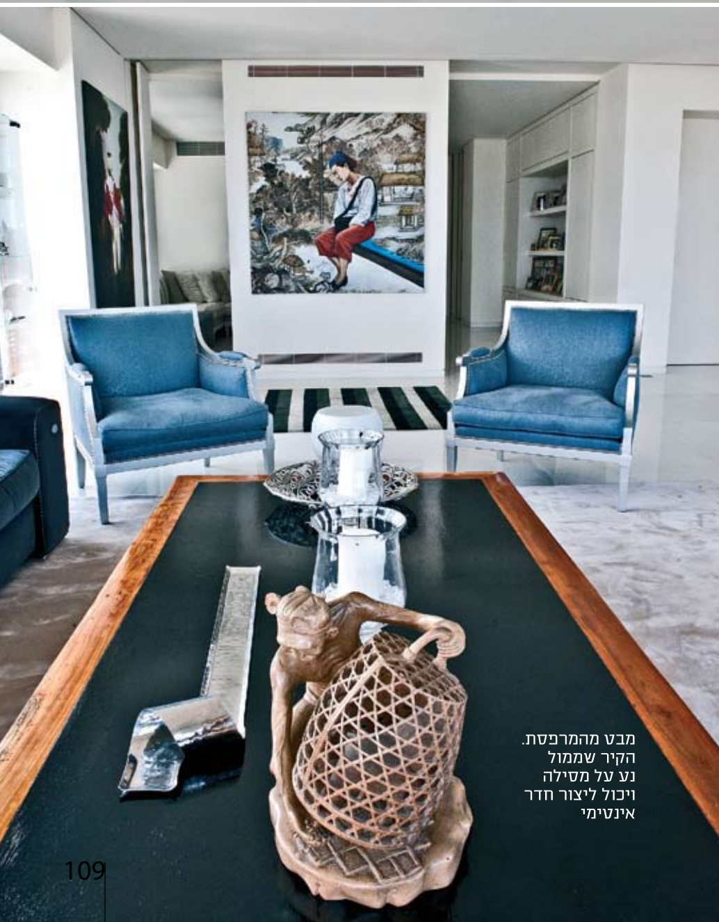
מבט מהמרפסת. הקיר שממול נע על מסילה ויכול ליצור חדר אינטימי

הדירה: בקומה 24, שתי דירות שאוחדו לחלל מרווח אחד. באגף המערבי נמצאים המטבח, חדר האוכל והסלון. מסדרון רחב וארוך מחבר בין הסלון לאגף המזרחי, שכולל חדר שינה נדיב, חדרי עבודה וחדר משפחה.