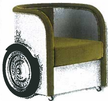
▲ כורסה מהקולקציה בסגנון מרכבות יוון ורומי, מרופדת קטיפה עם גלגלי ענק

מה יותר מרגש אותך, לפגוש ברחוב אישה שלובשת שמלה בעיצובך, או להיכנס לבית עם שירה או מראה בעיצובך?